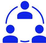
Kleine Eigentümer- Gemeinschaft